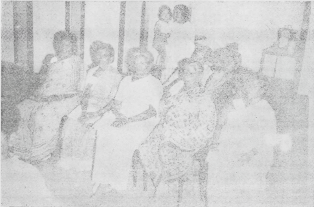
சுத்தரங்கில் பங்கு கொண்ட பெண்களில் ஒரு பகுதியினர்.