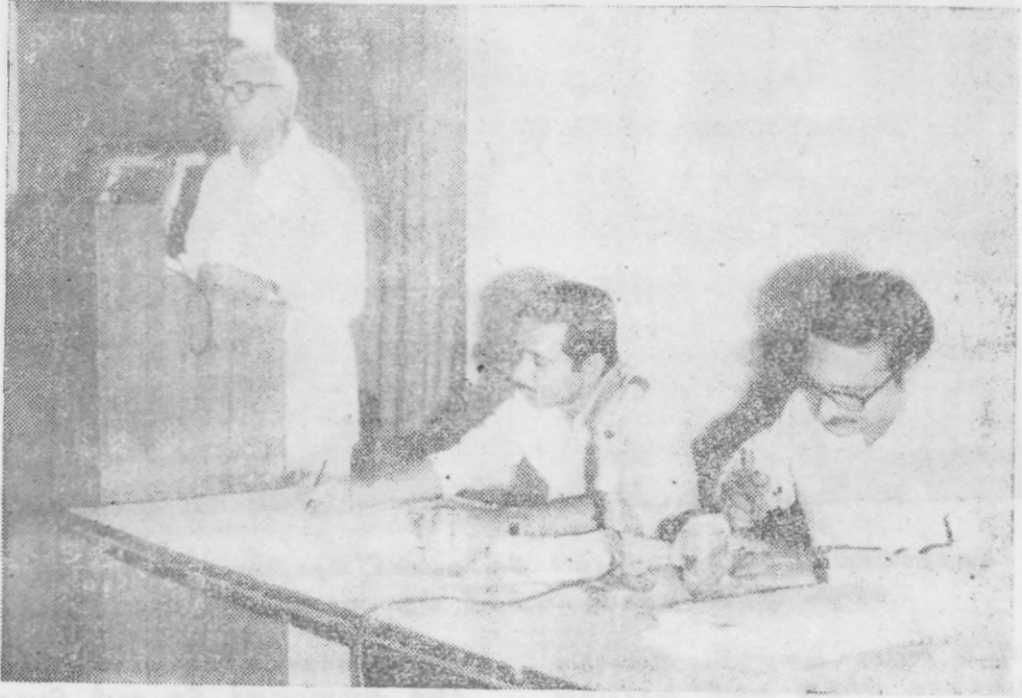
நீதிபதி வி. ஆர். கிருஷ்ணய்யர் அவர்கள் துவக்க உரையாற்றுகிறார்.

தமிழ் மாநில கட்டிடத் தொழிலாளர் சங்கத்தின் தேசிய கருத்தரங்கம் 1985 நவம்பர் 1, 2, 3, தேதிகளில் புதுதில்லி காந்தி சமாதான அரங்கத்தில் மிகச் சிறப்பாக நடைபெற்றது.