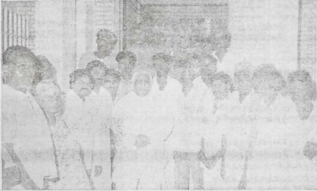
கருத்தரங்க பிரதிநிதிகளுடன் தொழிலாளர் நலத்துறை அமைச்சர்.