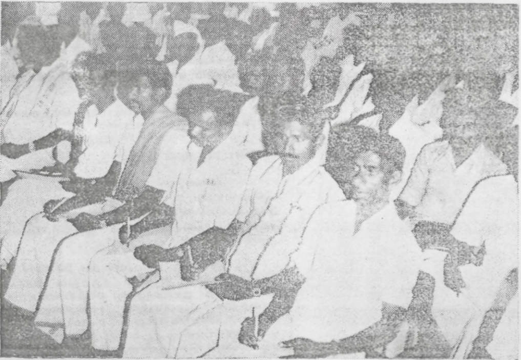
கருத்தரங்கில் கலந்து கொண்ட பிரதிநிதிகளின் ஒரு பகுதி.