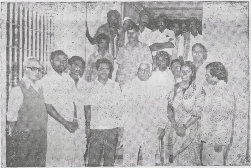
தொழிலாளர் நலத்துறை அமைச்சருடன் கருத்தரங்கில் கலந்து கொண்ட பிரதிநிதிகளின் ஒரு பகுதியினர்

யும் விவாதிப்பதில் பங்கேற்றனர். இந்த முயற்சி பயனுள்ளதாகவும், நம்பிக்கை யூட்டுவதாகவும் அமைந்தது. சில வலுவான ஆலோசனைகள் ஏகமனதாக பரிந்துரைக்கப்பட்டுள்ளன.