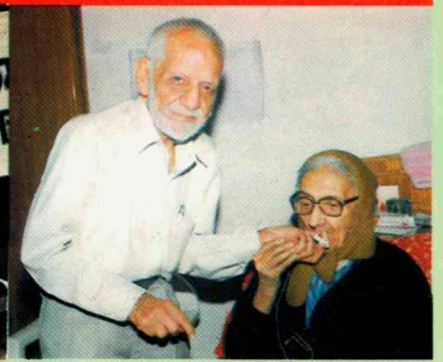
ਜ਼ਿੰਦਗੀ ਦੇ ਤਿੰਨ ਵੱਖੋ-ਵੱਖਰੇ ਪਹਿਲੂ